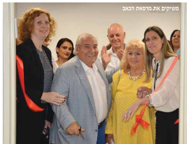
משיקים את מרפאת הכאב