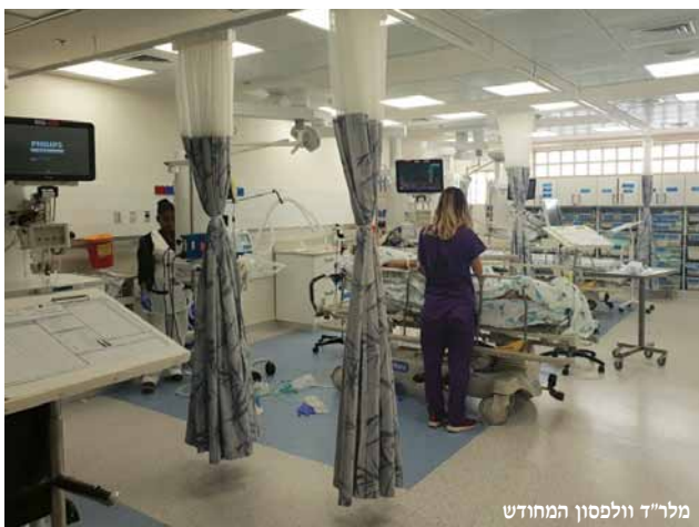
מלר"ד וולפסון המחודש

הושקו בוולפסון: חדר טיפולים פליאטיבי לחולים במחלות קשות, חדר הלם במיון ומרפאת כאב חדשה. ממשיכים לצעוד בכטחה אל קדמת הרפואה והשירות