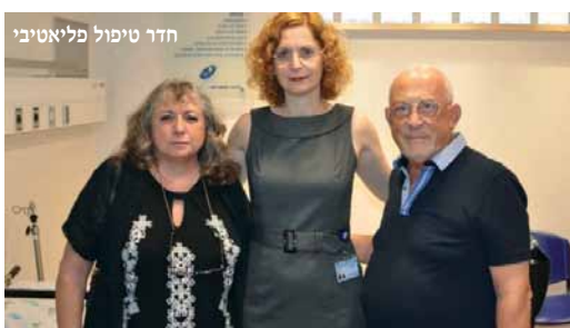
חדר טיפול פליאטיבי

האגודה למלחמה בסרטן, מירי זיו, שהעניקה אף היא תמיכה וסיוע בהקמת חדר הטיפולים.