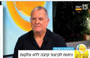
ערוץ 13, 25.4.18