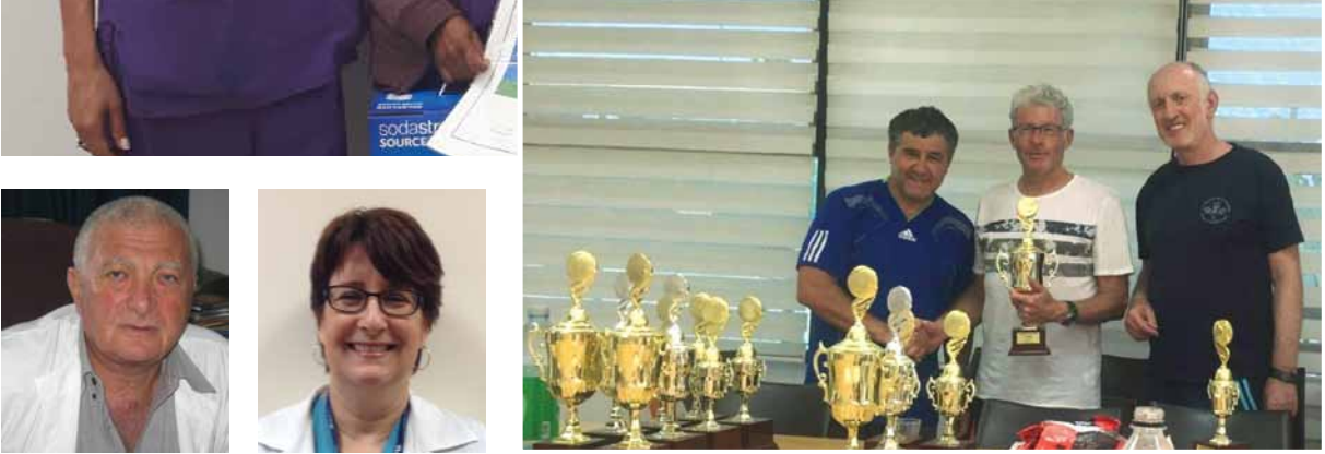
פרופ' ראובן צימליכמן