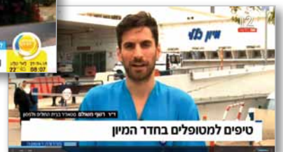
ערוץ 12, חברת החדשות, 6.5.18