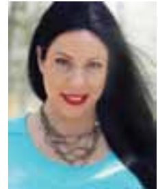
נויה אור יהב

מאת נויה אור יהב אחות אונקולוגית אקדמאית, יחידה המטואונקולוגית