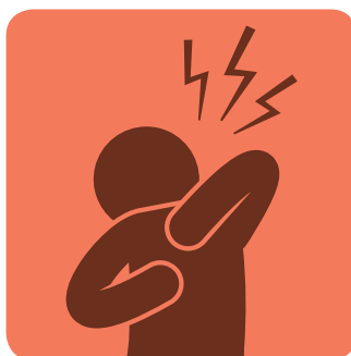
כאבי גב ושרירים