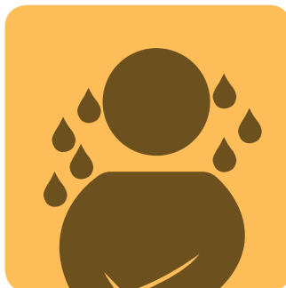
תופעות גיל מעבר