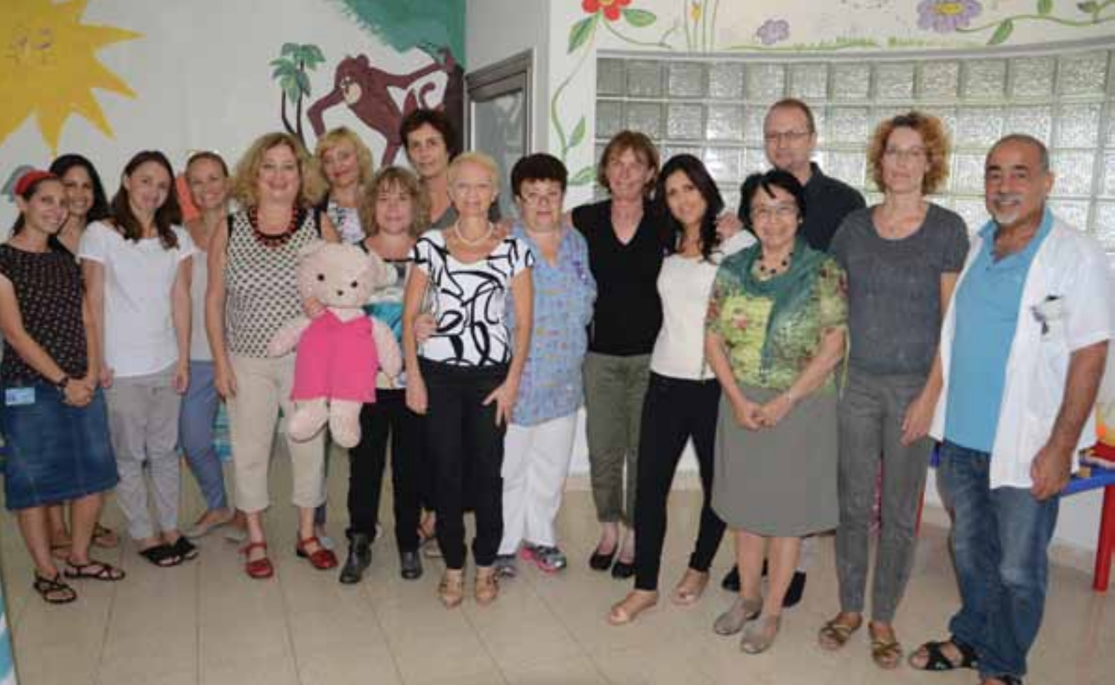
צוות מרפאת מג"ן