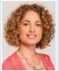
עובדי וולפסון היקרים,

"בטוקבקים מכנים אותם עוכרי ישראל, בחדר ההמתנה הם סופגים עלבונות מהורים ישראלים כועסים, אבל שום דבר לא מרפה את ידיהם של רופאי פרויקט 'הצל לבו של ילד' בבית חולים 'וולפסון' בחולון, שמצילים ילדים פלסטינים, גם בימים רגשיים וכפיצים". הערוץ המקומי של ynet נתן לכך ביטוי בכתבה נרחבת כמו גם העיתון "ישראל היום", רדיו תל אביב וכלי תקשורת רבים אחרים.