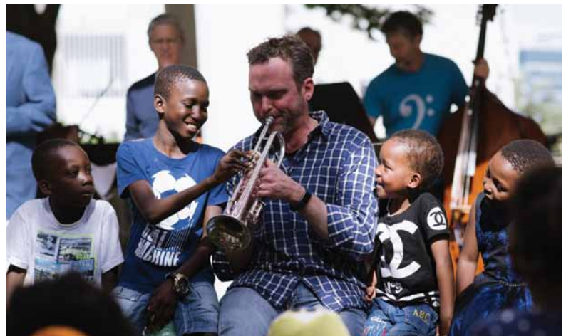
ילדי "הצל לבו של ילד" ונגני הסימפונית של טורונטו בבית העמותה בחולון

התזמורת הסימפונית של טורונטו ביקרה בפרויקט "הצל לבו של ילד" במרכז הרפואי וולפסון ובבית העמותה בחולון, שם ערכה קונצרט בפני קהל גדול של ילדים, אימהות, מתנדבים, צוות רפואי, צוות העמותה ואורחים. הנגנים שוחחו עם הילדים והסבירו להם על כלי הנגינה השונים. "הצל לבו של ילד" הוא פרויקט הומניטרי בינלאומי, שבסיסו בישראל, הדואג לניתוחי לב מצילי חיים ומעקב רפואי לילדים ממדינות מתפתחות. פעילות העמותה מרוכזת סביב המרכז הרפואי וולפסון ומתבצעת על ידי כמאה אנשי צוות מסורים מבית החולים, המקדישים לפרויקט זה חלק ניכר מזמנם, בהתנדבות ובאופן קבוע. עד כה טיפלה העמותה ב-4,000 ילדים מכ-50 מדינות מתפתחות, והכשירה למעלה ממאה אנשי צוות רפואי ממדינות אלו.