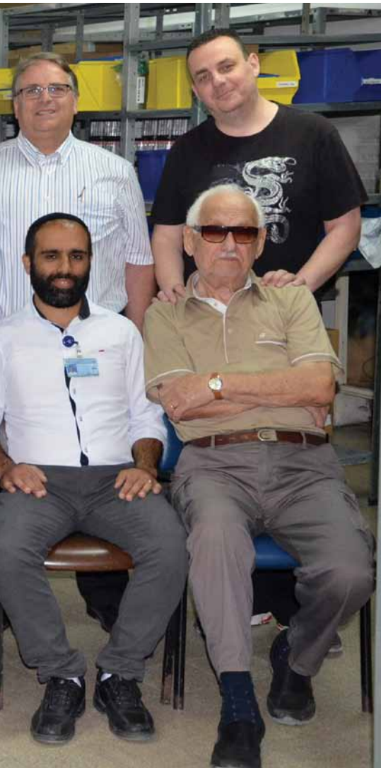
צוות אפסנאות רפואית