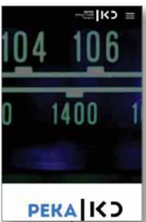
כאן רק"ע - יומן הערב, 24.5.17