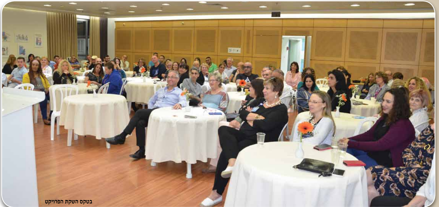
בטקס השקת הפרויקט