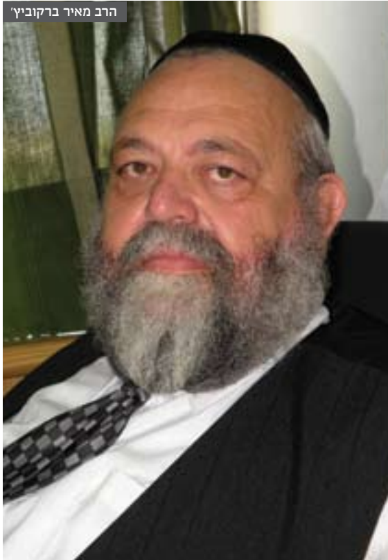
הרב מאיר ברקוביץ'