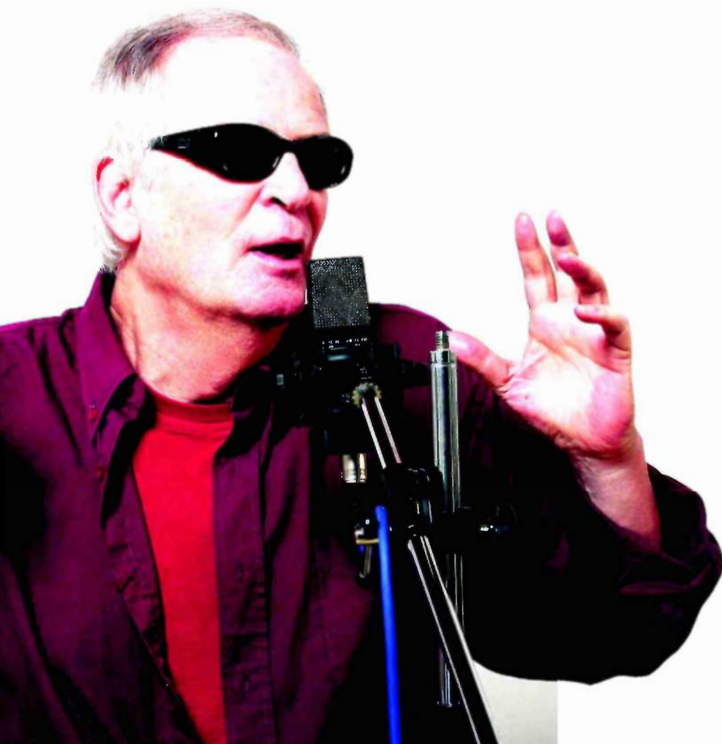
זכרונות חדשים עם "אוהב להיות בבית". אריק איינשטיין

המידע מגיע לאזור ההיפוקמפוס, שם עוברים הזכרונות תהליך של התבססות