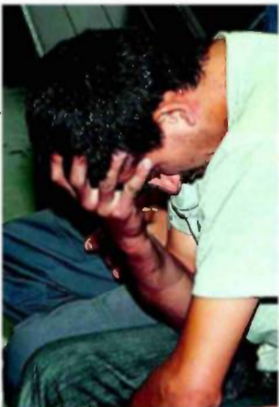
החשוד באונס בגן העיר

וידברג: "תארי לעצמך בחורות צעירות במיני או במי כנסונים, שאנו לוקחים מהן את התחתונים לדגימה. צריך לחשוב על הדברים הקטנים ביותר: נעליים חד-פעמיות, אבל הכי מפנקות, כמו בספא. הנה, בשבוע שעבר הגי-